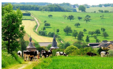
De Mergel- en Voerstreek

We wensen u een prettige en niet al te warme zomer toe.