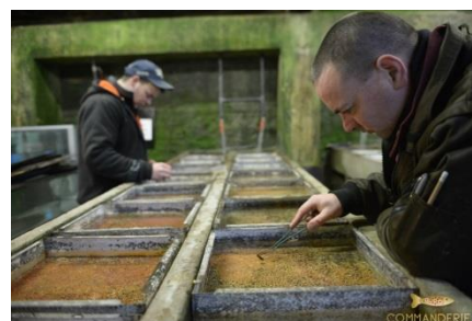
Het telen van de paling