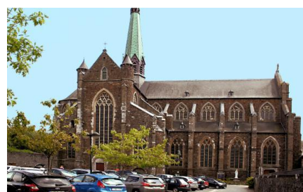
De Abdijs van Val Dieu