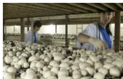
De champignon kwekerij

Daarna bezochten we de Abdijs van Val Dieu met geweldige uitleg door onze gids. We bezochten ook de basiliek van de abdijs. Vervolgens genoten we op het terras van een lekker trappistenbiertje om daarna terug te gaan naar ons restaurant voor de afsluitende koffietafel. Het was een prachtige reis op deze warme dag".